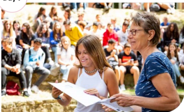
Day 7 Full-Day Excursion/Tour

Morning - Cambridge walking tour Afternoon - Cambridge walking tour Evening - Goodbye Party