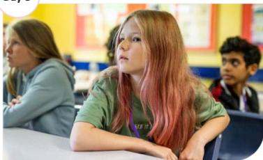
Day 8 Time To Return

Morning - To get back to your city preparations.