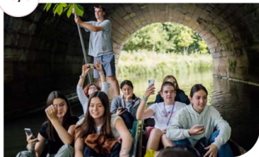
Day 6 English Lessons

Morning - Teaching time Afternoon - Teaching time Evening - Dance away at a disco!