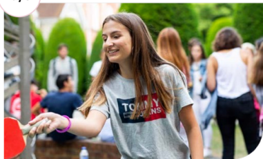
Day 5 Full-day excursion/tour

Morning - London walking tour Afternoon - London walking tour Evening - Grab the popcorn and settle down for film night